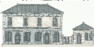
←歴史的遺構を保全し、公園施設等として市民に開放している事例 写真左: プラフ80メモリアルテラス(中区/元町公園内) 写真右: 旧税関事務所遺構(中区/赤レンガパーク内)